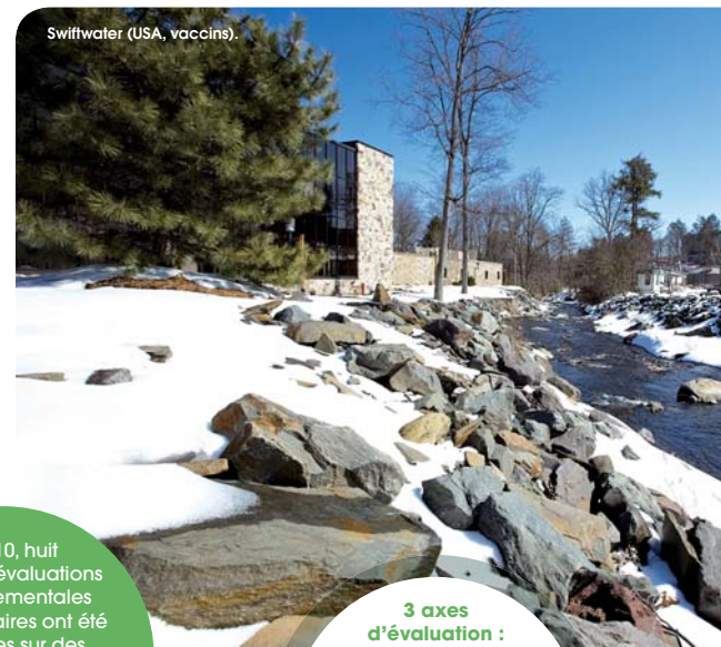
Swiftwater (USA, vaccins).

En 2010, huit nouvelles évaluations environnementales réglementaires ont été effectuées sur des médicaments en Europe et aux Etats-Unis dans le cadre de l'approbation de nouveaux produits Sanofi.