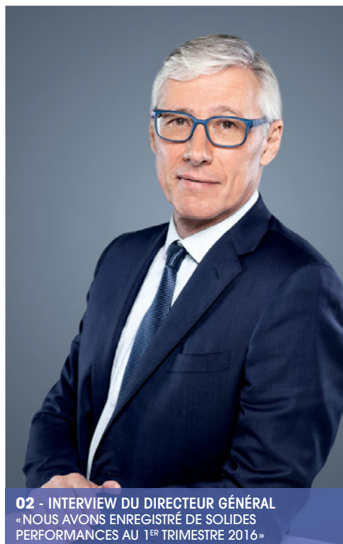
02 - INTERVIEW DU DIRECTEUR GÉNÉRAL « NOUS AVONS ENREGISTRÉ DE SOLIDES PERFORMANCES AU 1 ER TRIMESTRE 2016 »