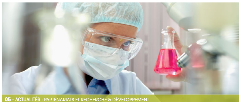
05 - ACTUALITÉS : PARTENARIATS ET RECHERCHE & DÉVELOPPEMENT