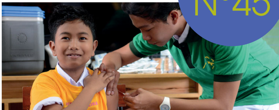
04 - ACTUALITÉS : PREMIER PROGRAMME PUBLIC DE VACCINATION CONTRE LA DENGUE LANCÉ AUX PHILIPPINES