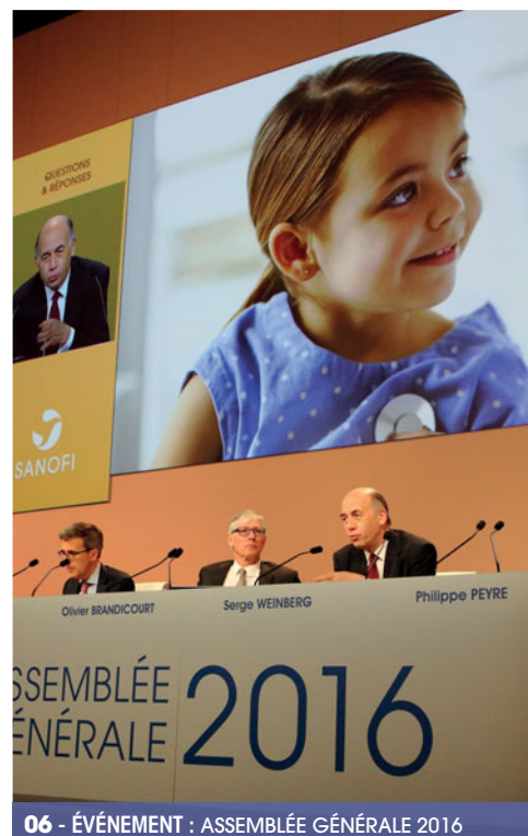
06 - ÉVÈNEMENT : ASSEMBLÉE GÉNÉRALE 2016