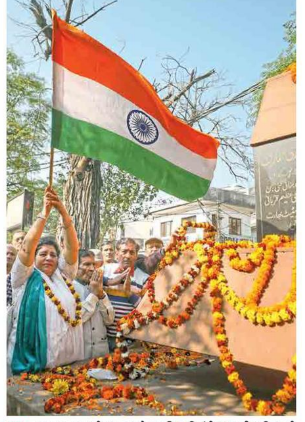
जम्मु : पाकव्याप्त काश्मीरमधून आलेल्या विस्थापितांनी शुक्रवारी पाकिस्तानी लष्कराच्या हल्ल्यामध्ये मृत्युमुखी पडलेल्या भारतीय नागरिकांच्या स्मरणार्थ पाळल्या जाणाऱ्या 'शहिद दिना'निमित्त स्मारकाला अभिवादन केले.

अशाच रिसर्च स्टोरीज, माहितीपूर्ण लेख वाचण्यासाठी ई-सकाळच्या 'प्रीमियम' सेक्शनला भेट द्या!