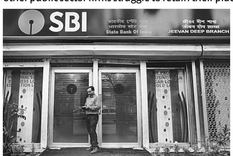
ΗΔΜ<ΙΝΙ ΚΔΡΤΗΙΚ Mumbai, 31 March

India's largest bank is now the most valuable state-owned entity, even as other public sector firms struggle to retain their place on the bourses