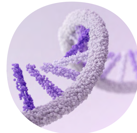
Représentation abstraite d'un brin d'ARNm