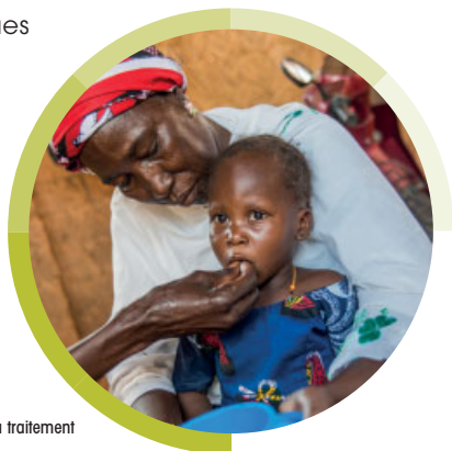
Administration du traitement au Burkina Faso

Depuis 2014, plus de 16 millions de traitements antipaludiques dérivés de l'artémisinine hémisynthétique ont été distribués dans les pays endémiques en Afrique.