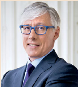
Olivier Brandicourt Directeur Général

Enfin, après avoir eu le privilège de vous faire part de mes premières observations et d'échanger avec vous lors de l'assemblée générale, je vais également rencontrer nos actionnaires institutionnels pour mieux comprendre leurs attentes.